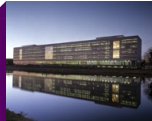
Het nieuwe hoofdkantoor van Rijkswaterstaat/Zeeland in Middelburg heeft een voorbeeldfunctie qua duurzaam bouwen.

Het actieve beton is gekoppeld aan koude- en warmte-opslag in de bodem. Hierbij wordt in de winter op 65 meter diepte in een watervoerende laag (aquifer) koude opgeslagen, die in de zomer gebruikt kan worden voor koeling. Omgekeerd wordt in de zomer op een andere plek in dezelfde laag warmte opgeslagen om het gebouw in de winter te verwarmen. Warmtewisselaars zorgen ervoor dat in de winter de warmte en in de zomer de koude van de aardbodem wordt gebruikt. Omdat elk gebouwdeel een aansluiting heeft op het distributienet, kan de vrij gekomen restwarmte of restkoude eerst onderling worden uitgewisseld. Het eventuele overschot kan opgeslagen worden in de centrale energieopslag of uitgewisseld worden met de temperatuur van de bodem. Dit innovatieve energievoorzieningssysteem is in vergelijking tot conventionele systemen 40 tot 50 procent energiezuiniger.