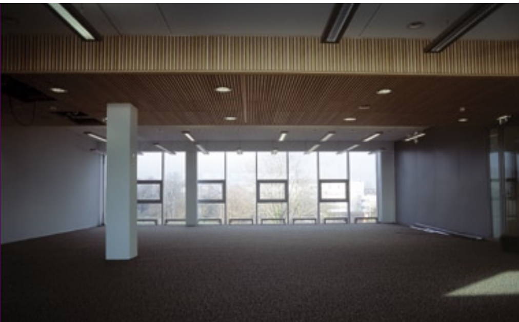
Dankzij de netto verdiepingshoogte van 3,1 meter kon een extra lichtraam worden geïntroduceerd, waardoor daglicht hoog in het vertrek binnenvalt en voor een deel via reflectie van de buitenlamellen dieper in het vertrek wordt gebracht.